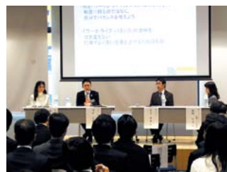
2月は関西大学梅田キャンパスで実施。